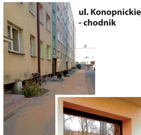
ul. Konopnickiej - chodnik