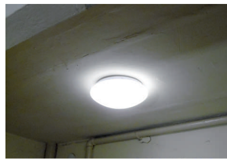
Wymiana oświetlenia na klatkach na LED