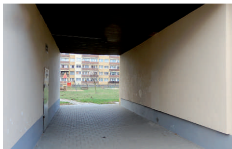
ul. Gałczyńskiego - odnowienie tunelu