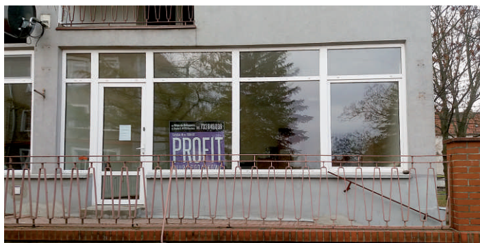
4. Biuro Podatkowe PROFIT, ul. Sienkiewicza 1