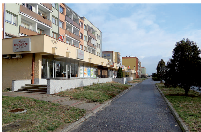
7. ul. Ligonia - deptak remont nawierzchni