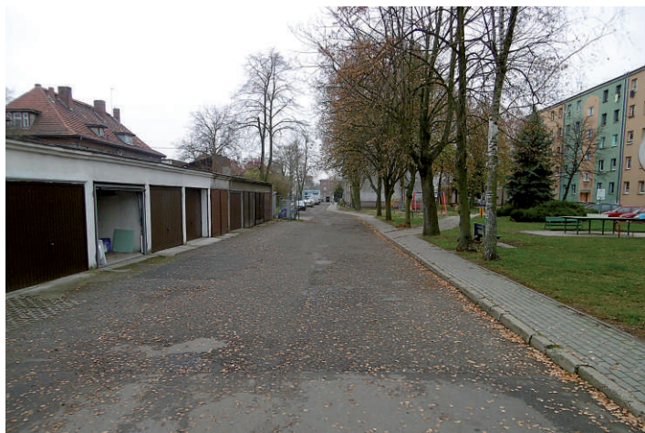
3. ul. Kochanowskiego 11-31 generalny remont nawierzchni