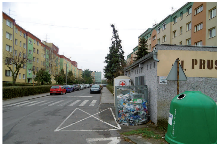
4. ul. Prusa jednostronne poszerzenie pod miejsca postojowe