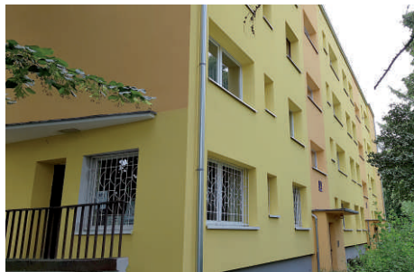
ul. Słowackiego - docieplenia