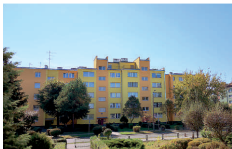
ul. Jana Pawła II 18-22, Morcinka 1 - docieplenia