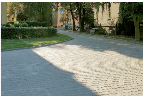
ul. Reymonta - remont chodnika