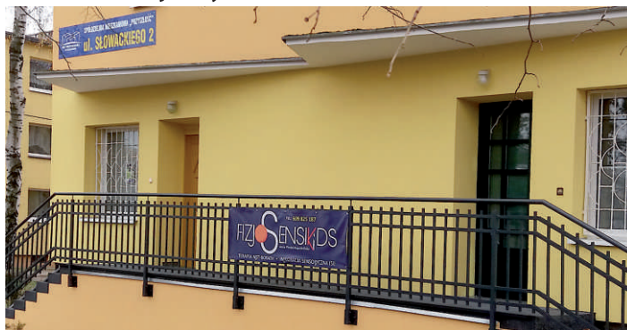
3. FizjoSensiKids, ul. Słowackiego 2

Oto nasi nowi najemcy, którzy w ostatnim czasie wybrali na swoją działalność lokale użytkowe Spółdzielni Mieszkaniowej „Przyszłość”.