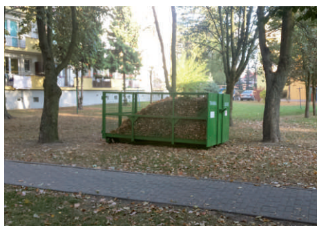
Nowe pojemniki na odpady zielone