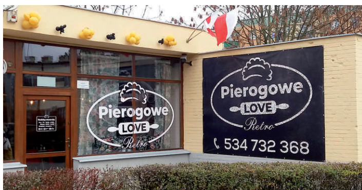
1. Pierogowe Love Retro, ul. Broniewskiego 10-12