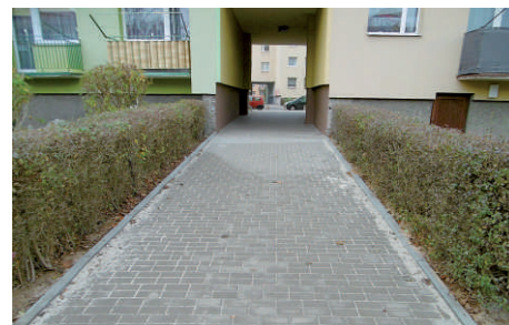
Nowe nawierzchnie z kostki