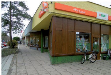
Wymiana witryn ul. Grunwaldzka