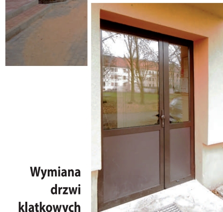
Wymiana drzwi klatkowych