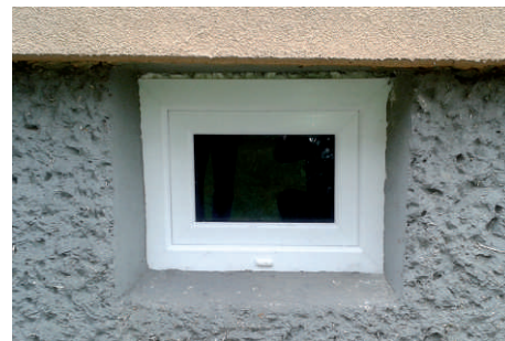
Wymiana okienek piwnicznych