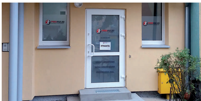
2. PROFIZJO Centrum Fizjoterapii, ul. Broniewskiego 13

Oto nasi nowi najemcy, którzy w ostatnim czasie wybrali na swoją działalność lokale użytkowe Spółdzielni Mieszkaniowej „Przyszłość”.