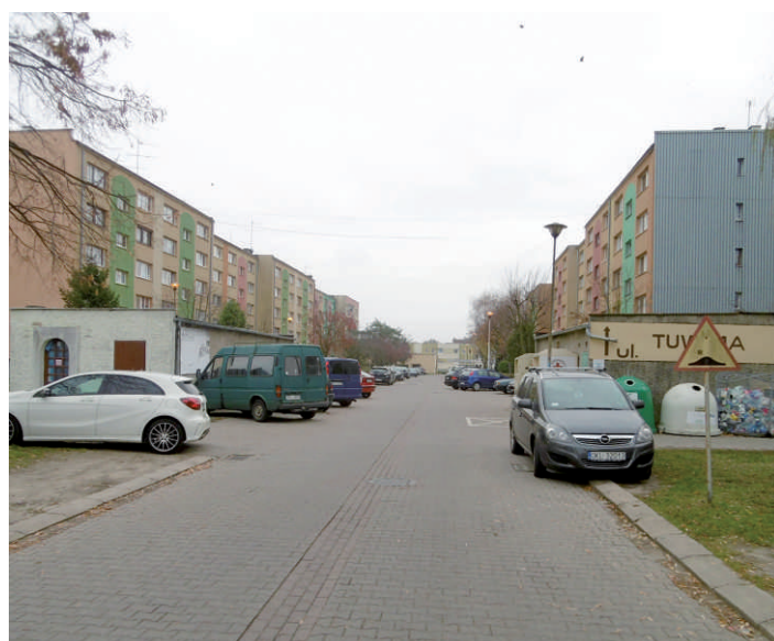
5. ul. Tuwima jednostronne poszerzenie pod miejsca postojowe