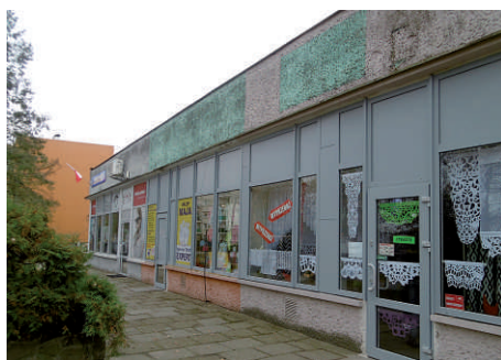
Wymiana witryn ul. Słowackiego