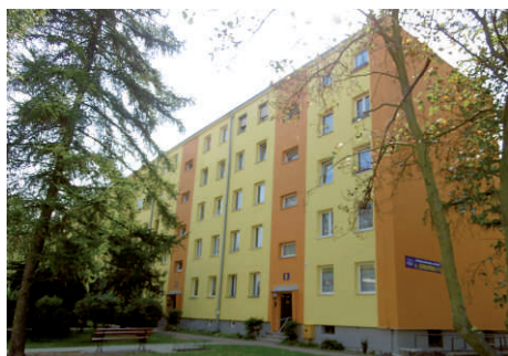
ul. Słowackiego - docieplenia