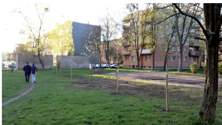
6. ul. Grunwaldzka budowa parkingu w miejsce rozebranej sali gimnastycznej