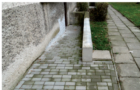
Zjazdy do piwnic