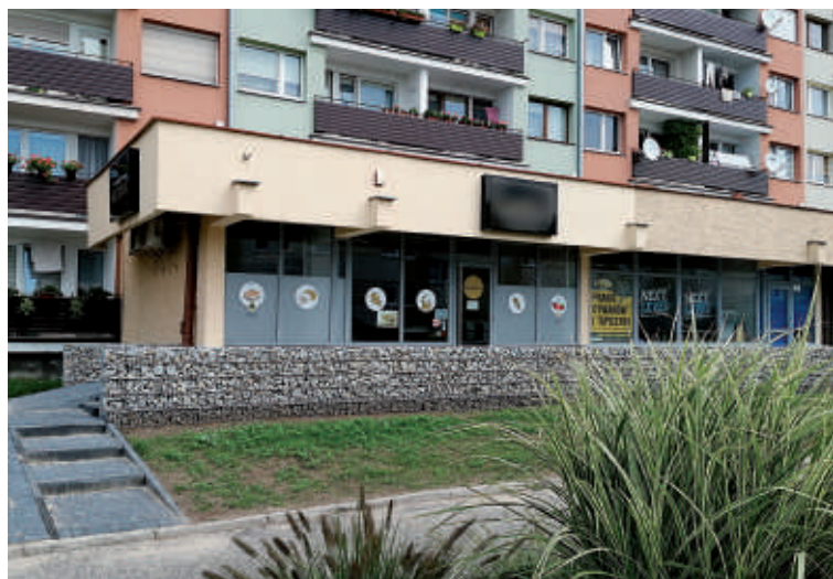
Remont murku pawilonu na ul. Tuwima