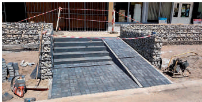
Podjazdy pawilon Tuwima