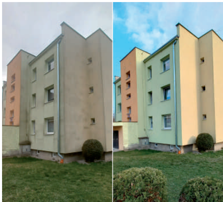
Mycie elewacji ul. Ligonia