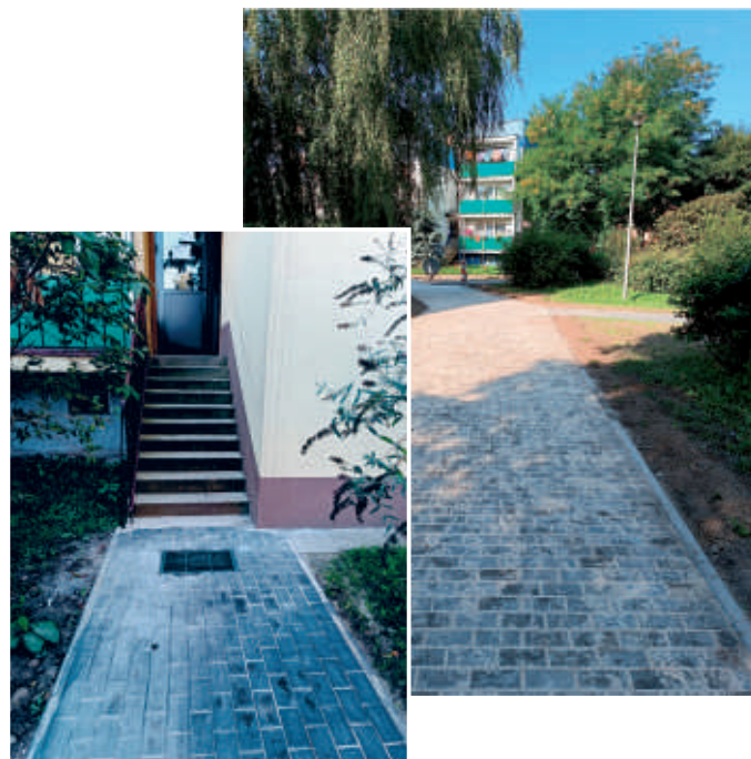
Ossowskiego - remont drogi