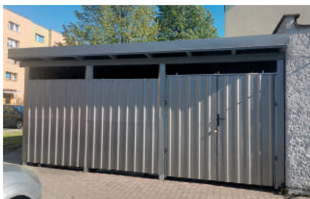
Rowerownia ul. Gałczyńskiego